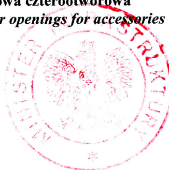
Tabela 1 Table 1