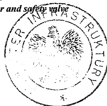
Tabela 1 (Table 1)