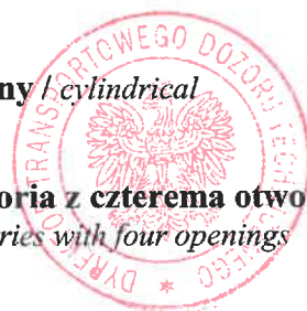
Tabela 1 / Table 1