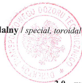
Tabela 1 / Table 1